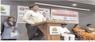
భీమవరం, జూన్ 26, పబ్లిక్ రిలే ప్రతినిధి