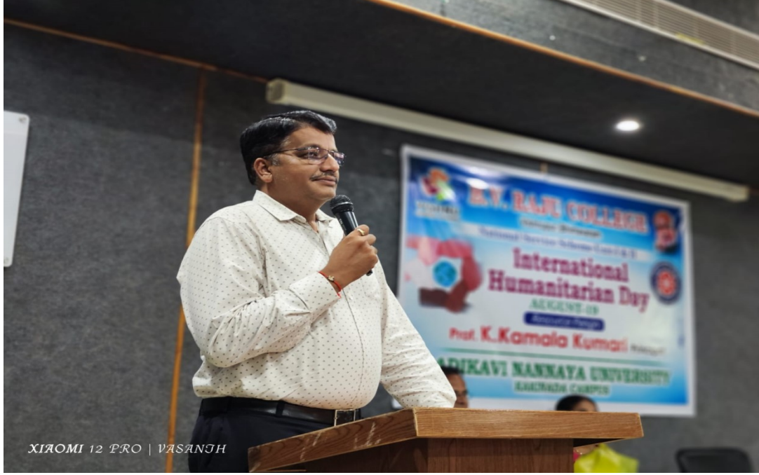
XIAOMI 12 PRO | VASANTH